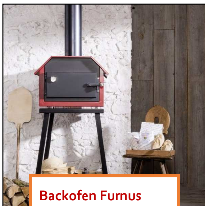
Backofen Furnus SILVA S1

(Unkostenbeitrag für die Backverkostung: 12,00 Euro pro Person, Getränke sind nicht inbegriffen)